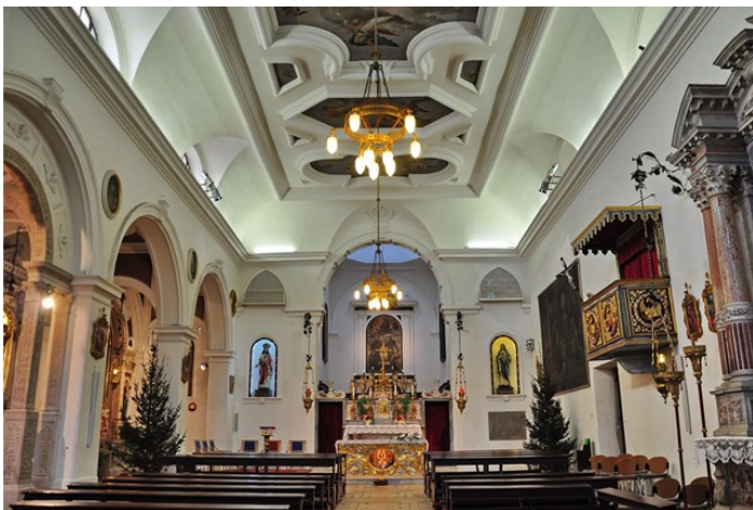
Pirano. La chiesa di S. Francesco

La pala cinquecentesca di Vittore Carpaccio torna a casa, a Pirano, dopo più di 80 anni. Giovedì è in programma la cerimonia per la ricollocazione dell'opera nella Chiesa di San Francesco dove era rimasta per secoli fino al 1940.