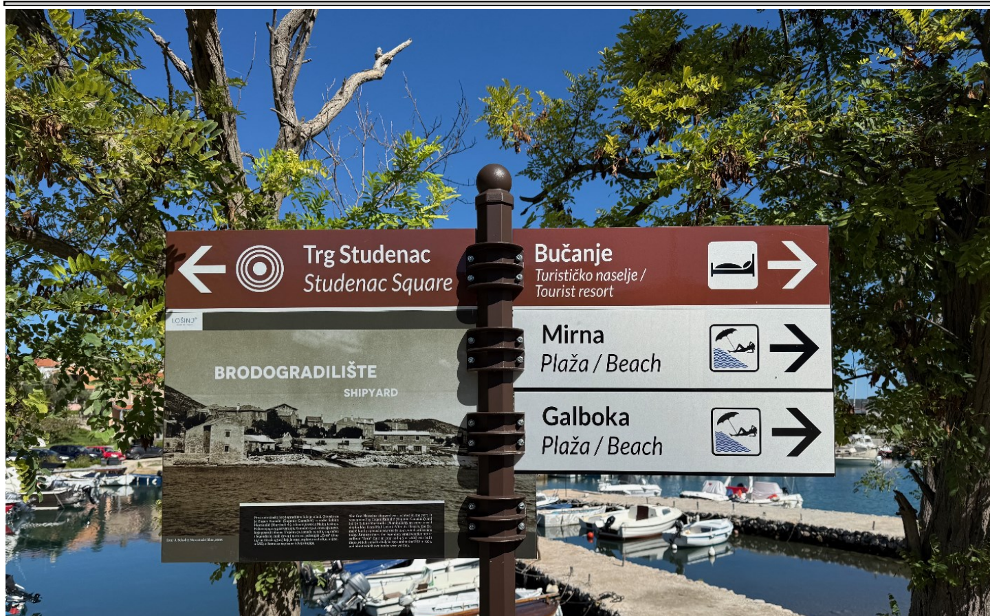
Square, Beach, Resort... Neresine international!