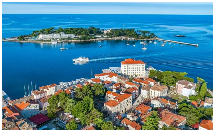
Una veduta dall'alto di Parenzo

Croazia, sempre meno pescatori e sempre meno pesce. Il rapporto 2024 redatto dal ministero dell'Agricoltura, foreste e pesca parla chiaro: l'anno scorso il pescato in mare ha toccato le 41 mila e 905 tonnellate, il 24% in meno rispetto al 2023.