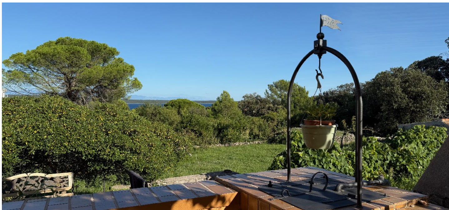
Veduta verso Bora all'altezza della chiesetta di S. Maria Maddalena