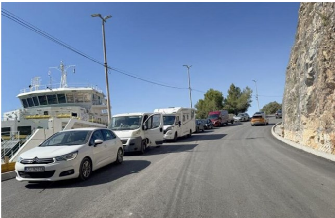
Lo scalo traghetti di Smergo (Merag)

Doveva essere un giorno storico per gli abitanti le isole di Cherso (Cres) e Lussino (Lošinj). Oggi, martedì 1.mo luglio, con il traghetto delle 8.30 in partenza da Smergo (Merag) verso Valbisca (Valbiska), avrebbe dovuto partire ufficialmente il progetto-pilota che garantisce priorità d'imbarco ai residenti delle isole. E invece, si è trasformato in un esempio perfetto di disorganizzazione istituzionale: nessuna segnaletica, nessuna corsia riservata, personale senza istruzioni, e l'unico presidio presente era... la Polizia, chiamata per evitare litigi tra automobilisti in coda. Chi questa mattina si è diretto al porto ha capi-