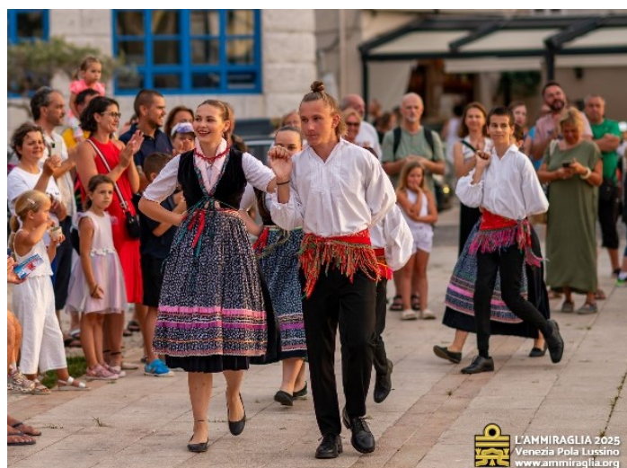
Festeggiamenti a Lussinpiccolo. Si esibisce il gruppo folcloristico “Studenac” di Neresine