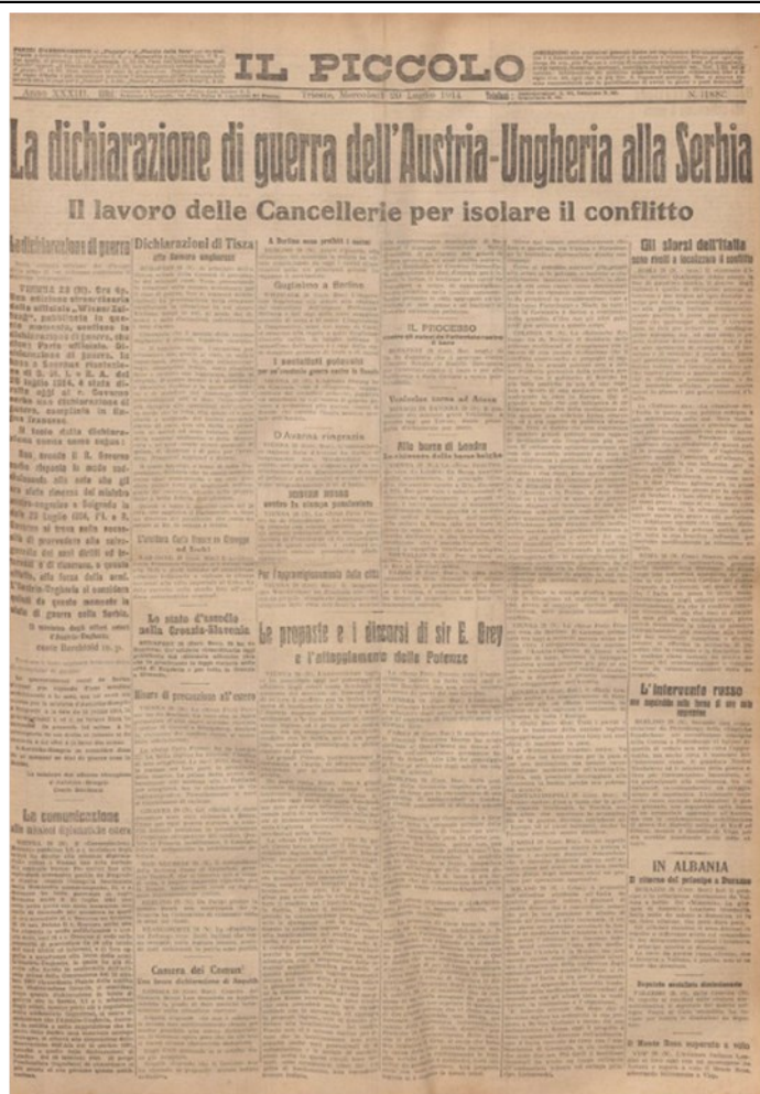
La prima pagina del 29 luglio 1914

Sangiacomo. Dichiaro infine non essere vero che più di 50 persone mi consigliarono di mettere i miei figli alla scuola italiana promettendomi la pensione.