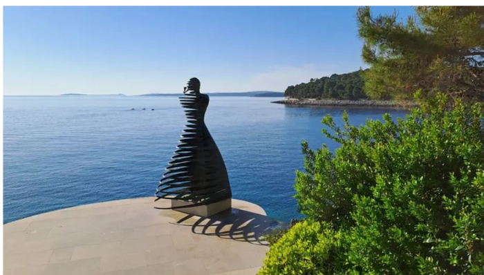
La statua "Addio"

L'opera bronzea della scultrice accademica croata Zvonimira Obad, statua alta 178 centimetri, è stata chiamata "Addio", quale struggente omaggio alle donne lussignane che salutavano i propri mariti marittimi proprio da quel lembo dell'isola nordadriatica, agitando i fazzoletti per farsi vedere dal consorte che – secoli fa – partiva a bordo di velieri per viaggi intorno al mondo. Che sarebbero durati anni, senza la certezza che il marito sarebbe tornato a casa a riabbracciare la moglie, i figli, i vecchi genitori, i parenti e gli amici. È una statua composta da cerchi di bronzo, attraverso cui passa la luce («La donna viene attraversata dal vento», ha spiegato la scultrice) e la cui presenza non rompe in alcun modo l'aspetto di Lussino in direzione delle isole di Sansego e Canidole.