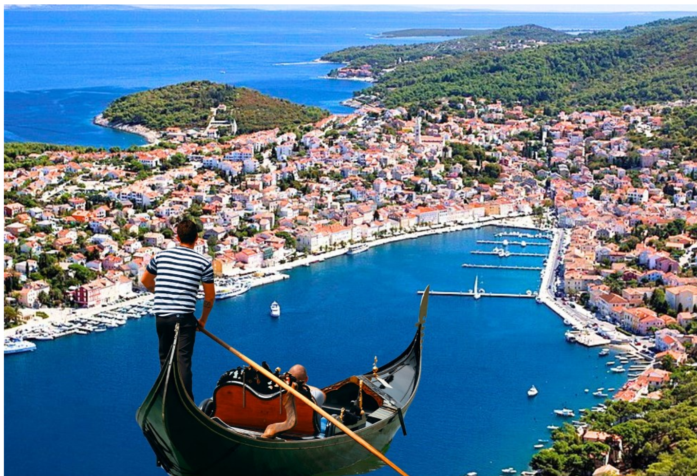
Fotocomposizione: la gondola e il porto di Lussinpiccolo