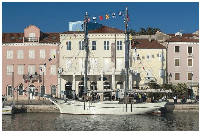
Il veliero Nerezinac

A 300 anni di distanza Casanova torna quindi protagonista in gondola e viene rievocato in Quarnero con le sue parole: "Il mio regno era stretto tra due rive d'acqua: bastava una gondola e il desiderio". Nei suoi Mémoires, Casanova scriveva "Se mi cercate, domandate al gondoliere".