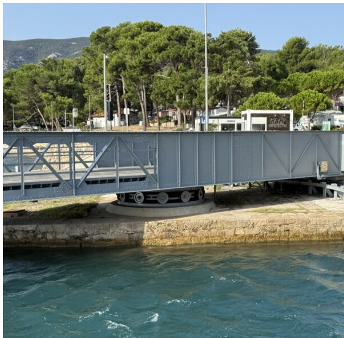
Il ponte girevole di Ossero

Ossero non è solo un punto geografico. È un luogo di passaggio, di incontri, di storia millenaria. Situato sulla sottile lingua di terra che un tempo univa Cherso e Lussino in un'unica isola, oggi separate da un canale, denominato Cavanella o Cavana, scavato dall'uomo già nell'età del Bronzo, il borgo è il simbolo di come ingegno umano e natura abbiano convissuto nei secoli. Quel canale, pensato per agevolare il transito delle navi da un mare all'altro, continua ancora oggi a scandire la vita della comunità grazie a un ponte girevole che rappresenta un raro gioiello di